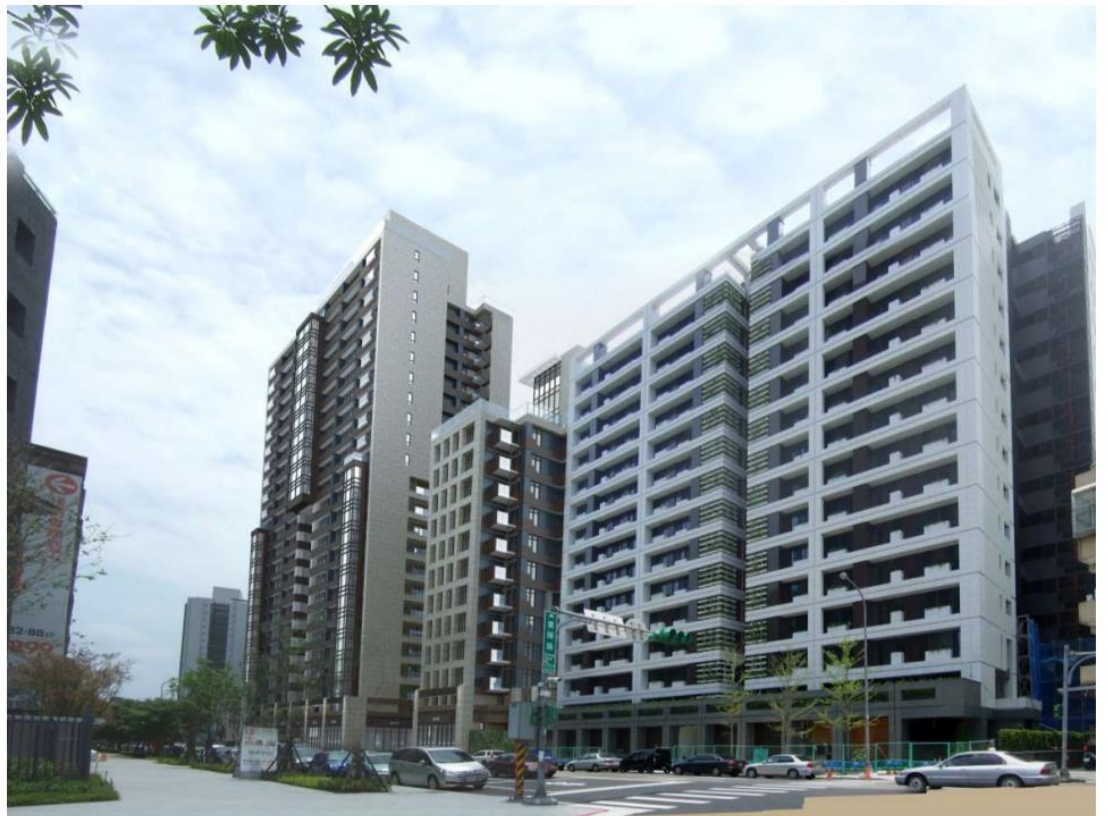
4. 透視圖 3