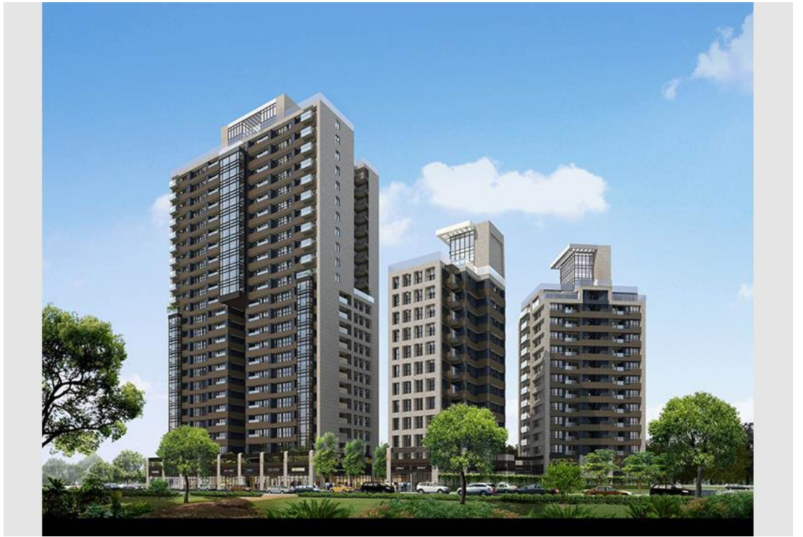
3. 透視圖 2